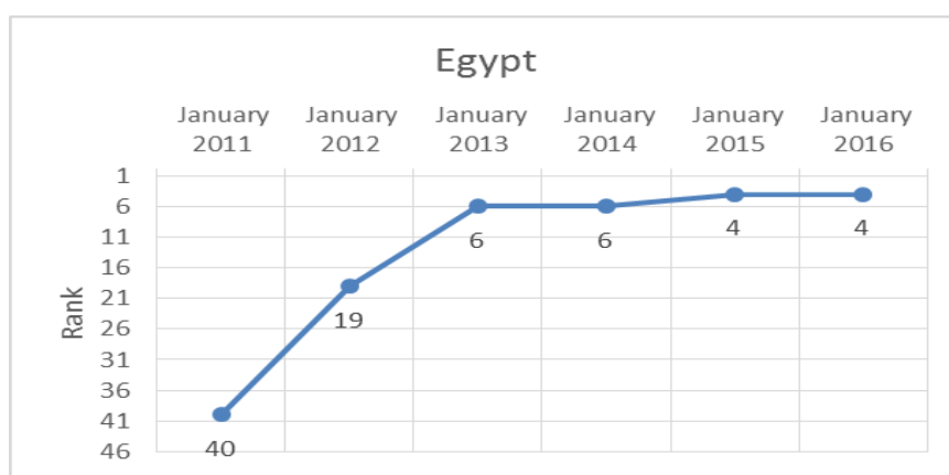
شكل رقم 2: تطور الترتيب العالمي لمؤشر ويبوميتركس لموقع جامعة بنها.